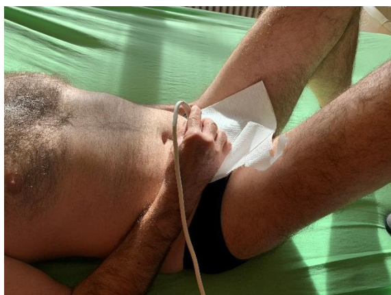
Obr. 2 Ukázka biofeedbacku nácviku kontrakcí a relaxace SPD vleže