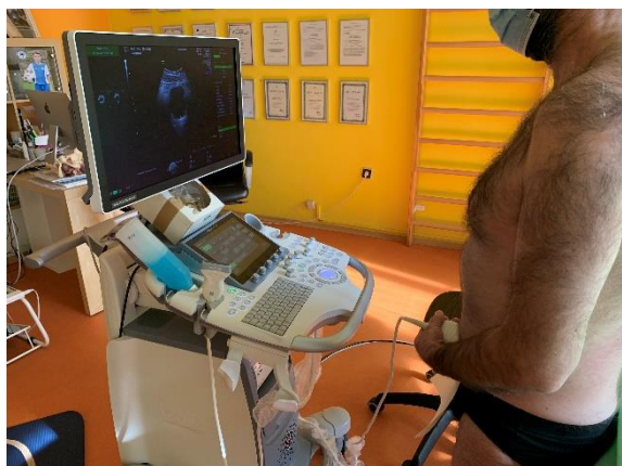
Obr. 3 Ukázka biofeedbacku návčiku kontrakcí a relaxace SPD ve stoji