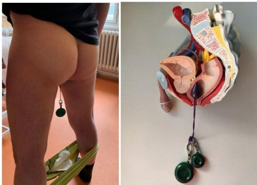
Obr. 4 Zavedené rektální závaží cvičení SPD ve stoji na pacientovi a modelu